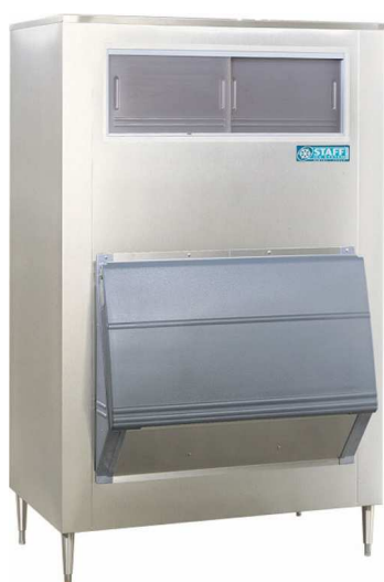
SG500-30 / SG700-30