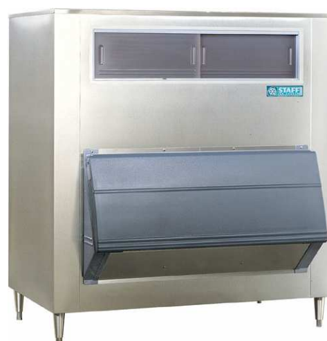
SG1010-48 / SG1475-60